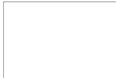
Figure 1: An example of figure

sed erat. Cras tristique ullamcorper est, suscipit ornare metus convallis vel.